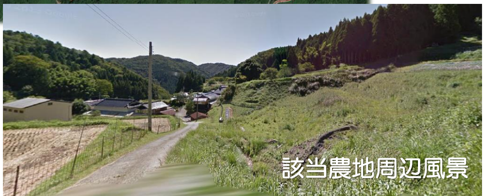
該当農地周辺風景