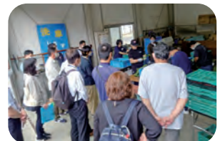
福祉事業所の作業現場を見学