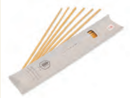
六条大麦ストロー

作業に集中できる広い屋内スペースを確保。乾燥させた麦の茎の外皮をむき、ストローとして使える茎の節と節の間が18cm～22cmになるように裁断します。目で確認できるように、茎を当てて切りやすくした採寸箱を作って活用しています。作業期間は6～7月の約45日間。報酬は時間給制を採用しています。