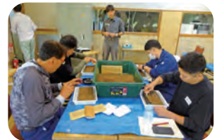
セルトレイへの播種で作業細分化や難易度を評価