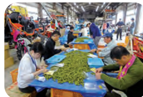
枝豆の出荷調製で作業細分化や難易度を評価