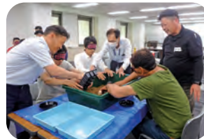
アイマスクをして視覚障害者への支援方法を学ぶ